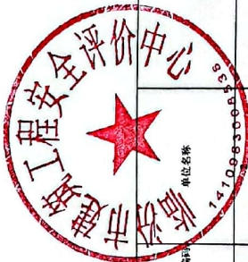
2022年政府采购预算明细表